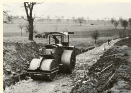
Erste grosse Investition: Die Walze «Kaelble» für 28000 Franken