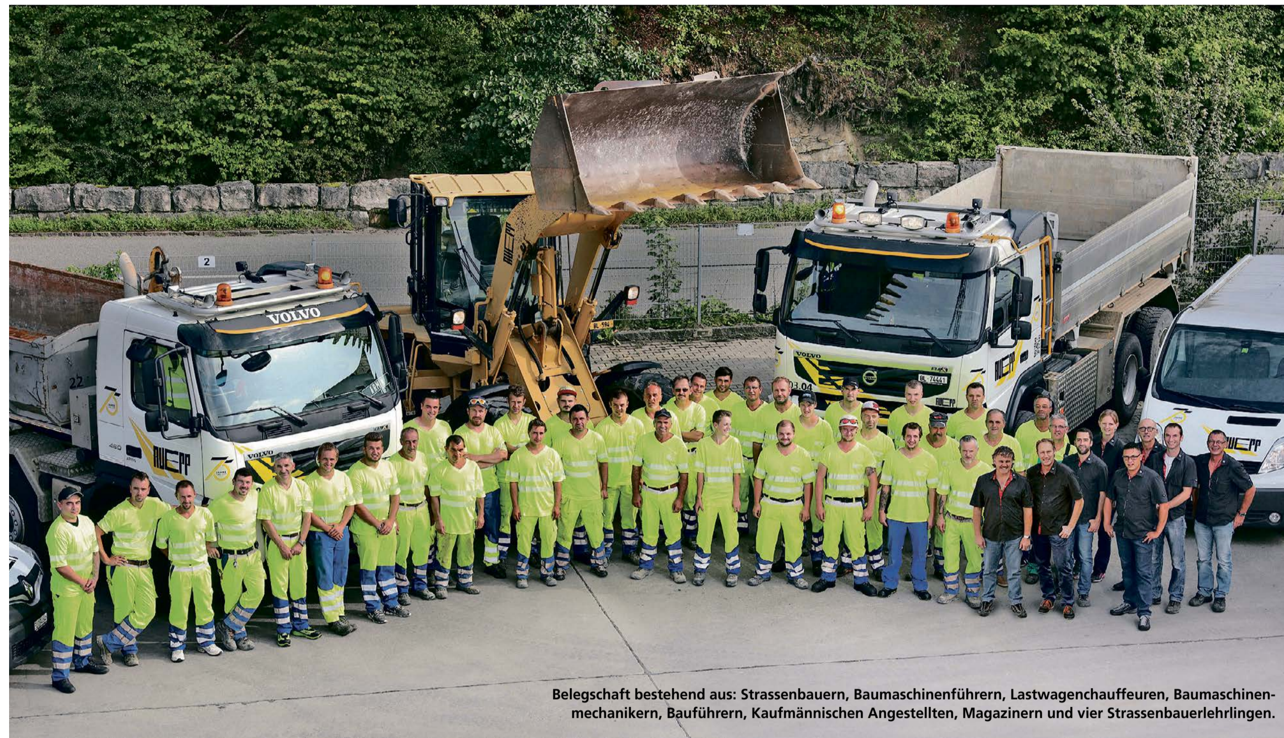
Belegschaft bestehend aus: Strassenbauern, Baumaschinenführern, Lastwagenchauffeuren, Baumaschinenmechanikern, Bauführern, Kaufmännischen Angestellten, Magazinern und vier Strassenbauerlehrlingen.

Anwil/Ormalingen | Die Ruepp AG feiert ihr 75-jähriges Bestehen