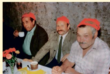
Die ersten Gastarbeiter kamen Anfang der 60er-Jahre aus Süditalien